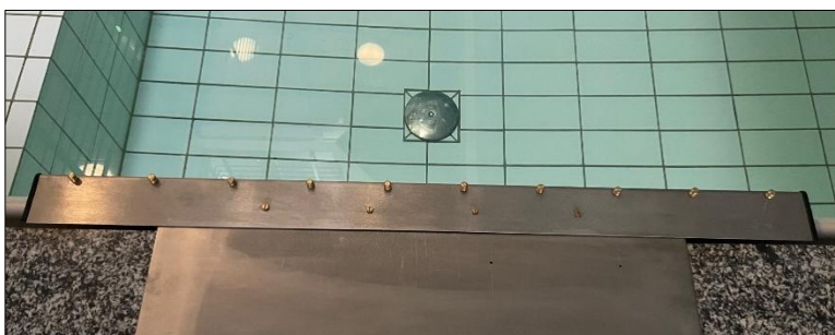
Hafen 2 (Pollerabstand von 15 cm)