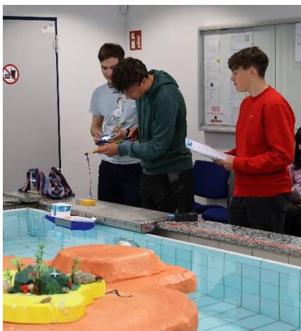
DIY-Schiff aus 2025

Die teilnehmenden Schüler_innen sollen das Transportmittel (ein ferngesteuertes Schiff) im Vorfeld der Veranstaltung nach strategischen, logistischen und schiffbaulichen Aspekten selbst konstruieren und bauen. Dazu gibt es keine Einschränkungen – allerdings muss es sich mit den bereitgestellten Modellcontainern (Maße 60*24*26mm) beladen lassen.