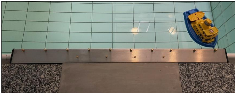
Hafen 1 (Pollerabstand von 15 cm)

Das Transportmittel kann in den Häfen anlegen, dazu muss es in die Nähe der Kaimauer navigiert werden. Das Anlegen erfolgt über Leinen, mit denen das Schiff an der Pier festgemacht werden kann bis das Be- und Entladen erledigt ist. Das Modell darf in der Zeit nicht per Hand festgehalten werden. Im Becken stehen zwei sich gegenüberliegende Häfen mit regelmäßigem Pollerabstand von 15 cm und einer Gesamtlänge (Poller zu Poller) von 135 cm sowie ein weiterer Hafen mit wechselnden Pollerabständen und einer Gesamtlänge von 115 cm zur Verfügung. Die Leinen müssen mit einem Auge versehen sein, das ein einfaches Einhängen an den Pollern ermöglicht. Der Durchmesser des Leinenauges beträgt mindestens 1,5 cm, empfohlen werden etwa 2 cm für eine bessere Handhabung. Die Schiffe dürfen nicht festgehalten werden.