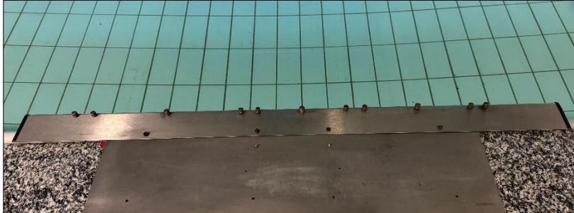
Hafen 3 (Pollerabstand unregelmäßig)

5 cm • 20 cm • 20 cm • 5 cm • 12,5 cm • 12,5 cm • 5 cm • 15 cm • 15 cm • 5 cm (beginnend links am ersten Poller)